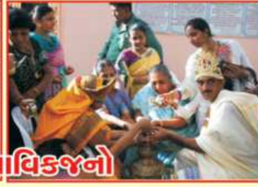
ભોજનશાળાનું ભૂમિ પૂજન કરતા