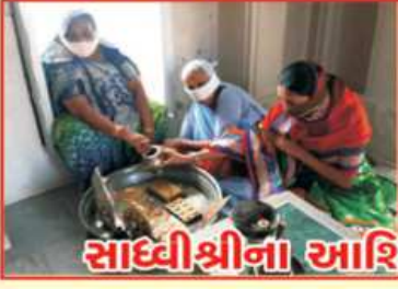
સાધ્વીશ્રીના આશિર્વાદથી પૂજામાં મગ્ન ભાવિકજનો