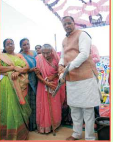
માતૃશ્રી ભાણબાઈ પાસુભાઈ ગોસર પરિવાર