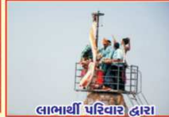
લાભાર્થી પરિવાર દ્વારા દેવજીરોહણ