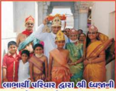
લાભાર્થી પરિવાર દ્વારા શ્રી દેવજીની દેરાસરજીને પ્રદક્ષીણા