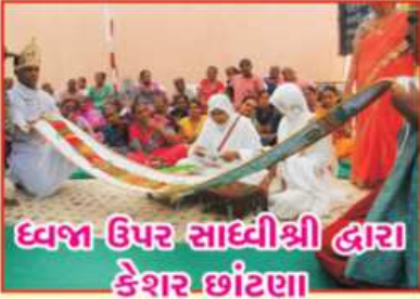
દેવજી ઉપર સાધ્વીશ્રી દ્વારા કેશર છાંટણા