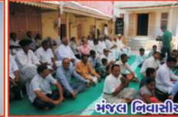
મંજલ નિવાસીઓ, ગ્રામ્યજનો તથા આજુબાજુના પરિસરથી પધારેલ ભાવિકજનો